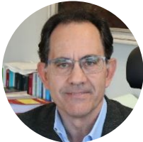
Román García Oliver

El desplazamiento de trabajadores y la movilidad internacional están generando numerosas y nuevas situaciones que ponen de manifiesto la necesidad de conocer los aspectos legales y las consecuencias jurídicas más importantes.